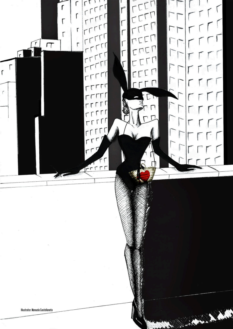
Illustrator: Manuela Castelloneta