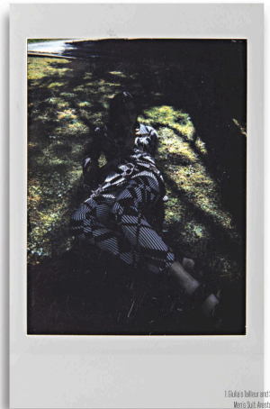
1 Blazer and skirt 2 Blazer and skirt 3 Blazer and skirt 4 Blazer and skirt