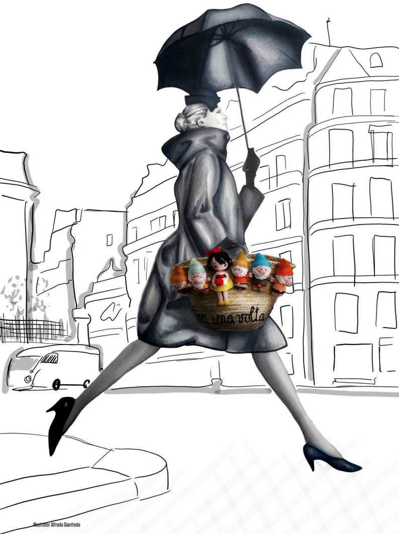
Illustrazione: Alfredo Gianfreda