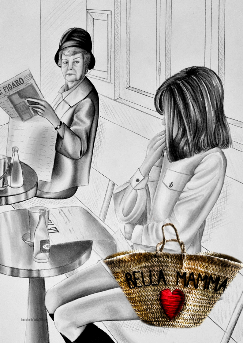
Illustrator: Raffaello D'Urbino