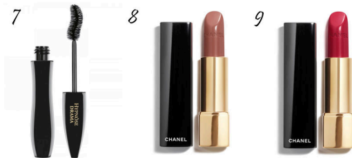
1. Dior fondotinta 2. Dior cipria 3. Givernohy blush 4. Diego della Palma matita occhi 5. Diego della Palma matita sopracciglia 6. Dior palette occhi 7. Lancome mascara 8. Chanel rossetto 9. Chanel rossetto