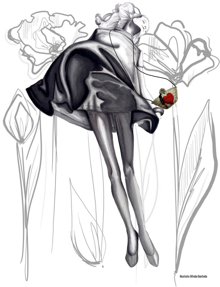
Illustrator: Alberta Gianfreda