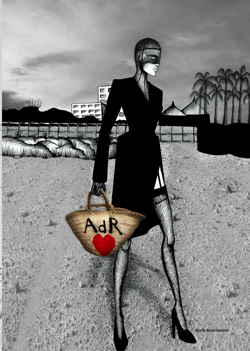
Illustrator: Micaela Castellonista